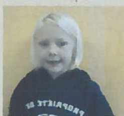
Summer 1ère Gènevève

QUELLE EST TA PARTIE PRÉFÉRÉE DE L'HALLOWEEN?