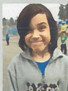
Raffi 4ième Donald

« J'aime pouvoir me coucher plus tard. »