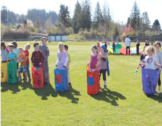
Je bats ma francophonie